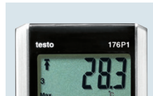
Großes und übersichtliches Display zur Messwertanzeige