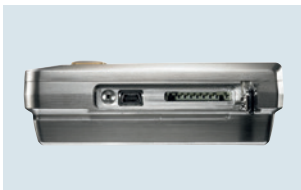
Seitlicher Anschluss von Mini-USB-Kabel und SD-Karte

* Nicht für betauende Atmosphäre. Für kontinuierlichen Einsatz in Hochfeuchte (>80 %rF bei ≤30 °C für >12 h, >60 %rF bei >30 °C für >12 h) kontaktieren Sie uns bitte über unsere Webseite.