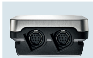
Fühleranschlüsse am unteren Gehäuseende für zwei Temperatur-/Feuchtefühler