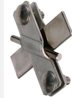
Figures without obligation