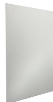
VL-Axxxxx in Weiß