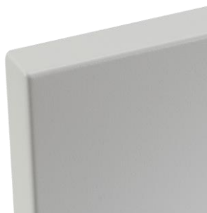
Detail der Ecke