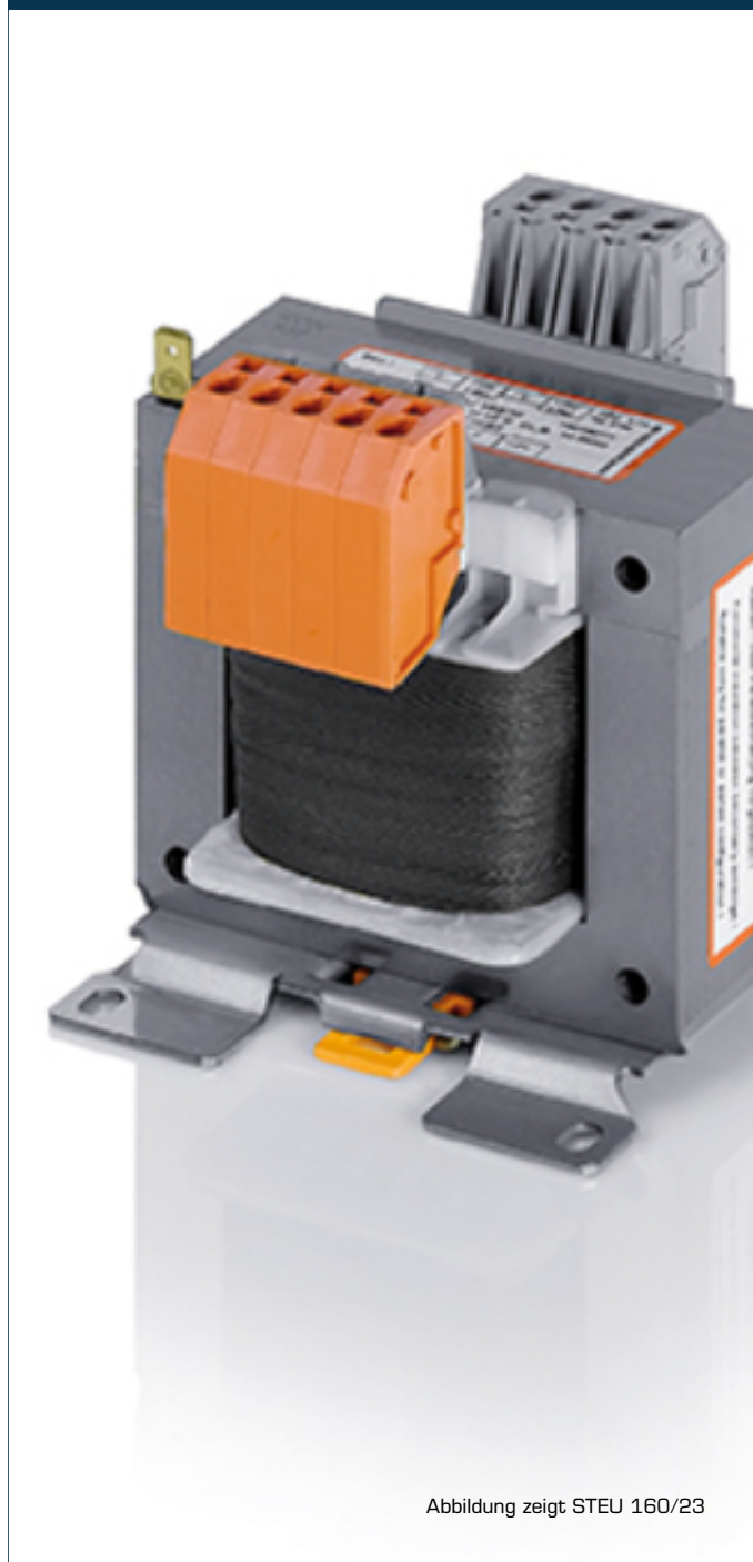
Abbildung zeigt STEU 160/23