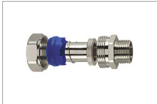
HelaGuard PCS-FMC starre Kompressionsverschraubung.