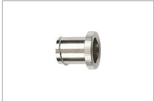
HelaGuard PCS-EI Endverschluss.