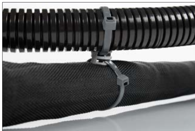
T50RCOUPLER zur parallelen Führung zweier Bündel.