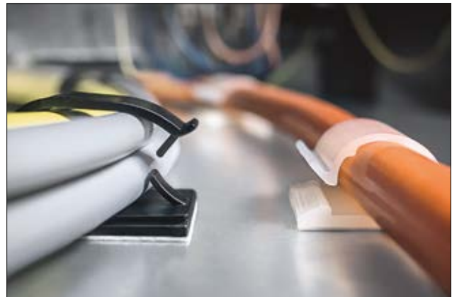
Einteilige, selbstklebende Befestigungssockel RB20 (l) und RB14 (r).