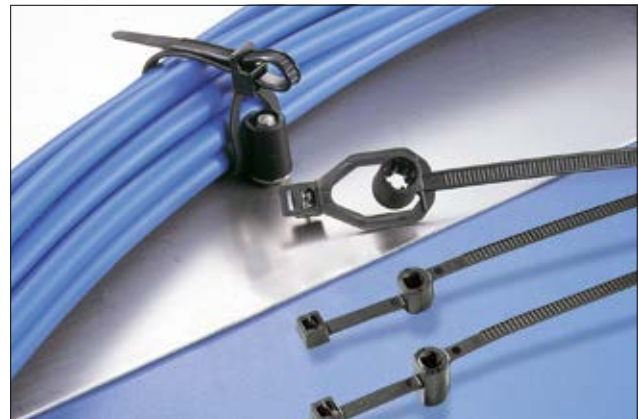
Mit dieser Art von Befestigungsbindern lassen sich z. B. Schläuche an Schweißbolzen fixieren.