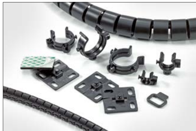
Das Helawrap Zubehör eignet sich zur Bündelung und zum Schutz mehrerer Kabelstränge und Leitungen.