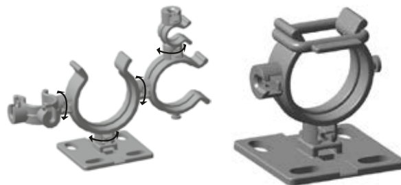
Jeder Helawrap Clip (PA66HIRHS) verfügt über mehrere Kupplungen für eine hohe Flexibilität bei der Führung von Kabelsträngen