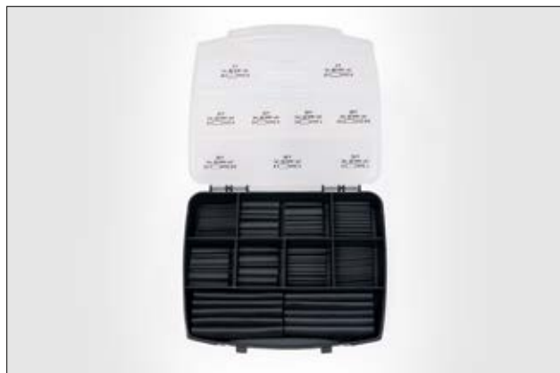
ShrinkKit 321 Basic - 3:1 Schrumpfschlauch Sortiment mit 220 Abschnitten.