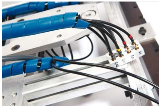
Detektierbare, metallhaltige Spiralschläuche schützen Kabel an Lebensmittelverarbeitungsmaschinen.