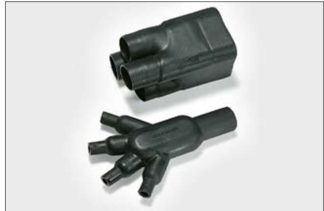
411-1-G ungeschrunft und vollständig geschrumpft.