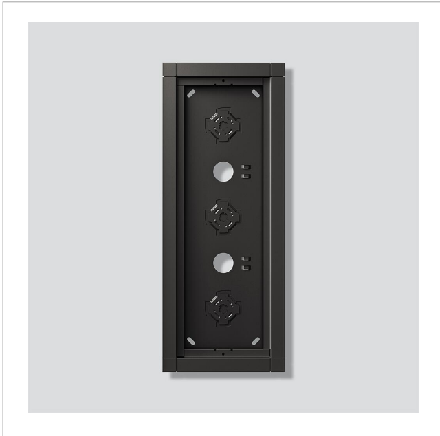
Gehäuse-Aufputz GA 612-3/1-01 DG