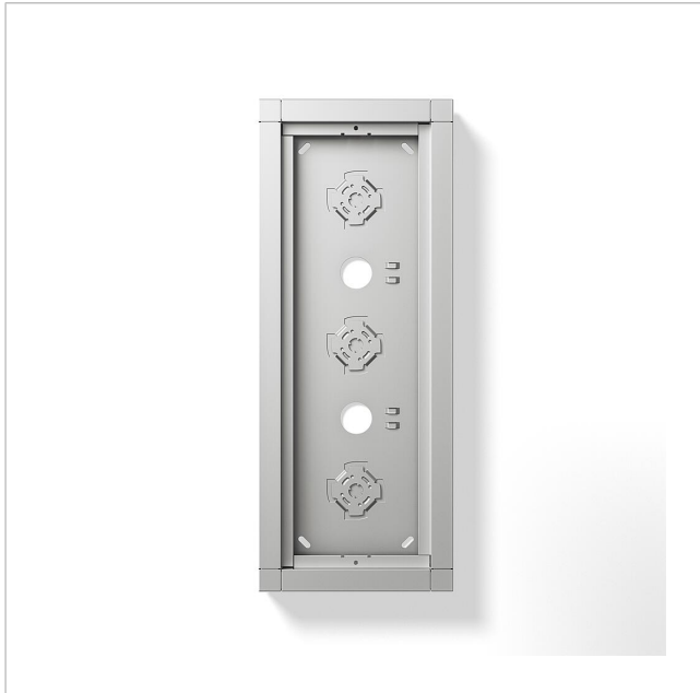
Gehäuse-Aufputz GA 612-3/1-01 SM