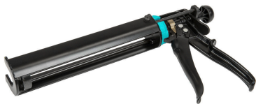
MIS MW, Kartuschenpistole