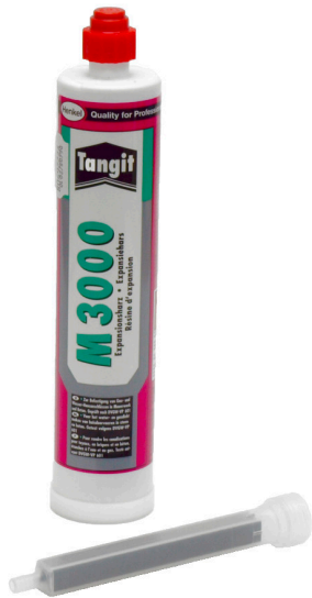
EH 300/1400, 2-Komponentenharz M3000