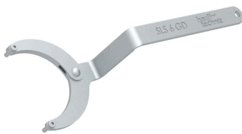
SLS 6G, Gelenkstirnlochschlüssel