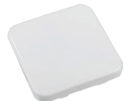
1x EIN/AUS | 2x IMPULS RTS32-ACC-01-xxP