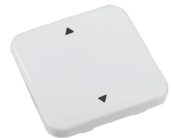
1x AUF/ZU RTS32-ACC-02-xxP