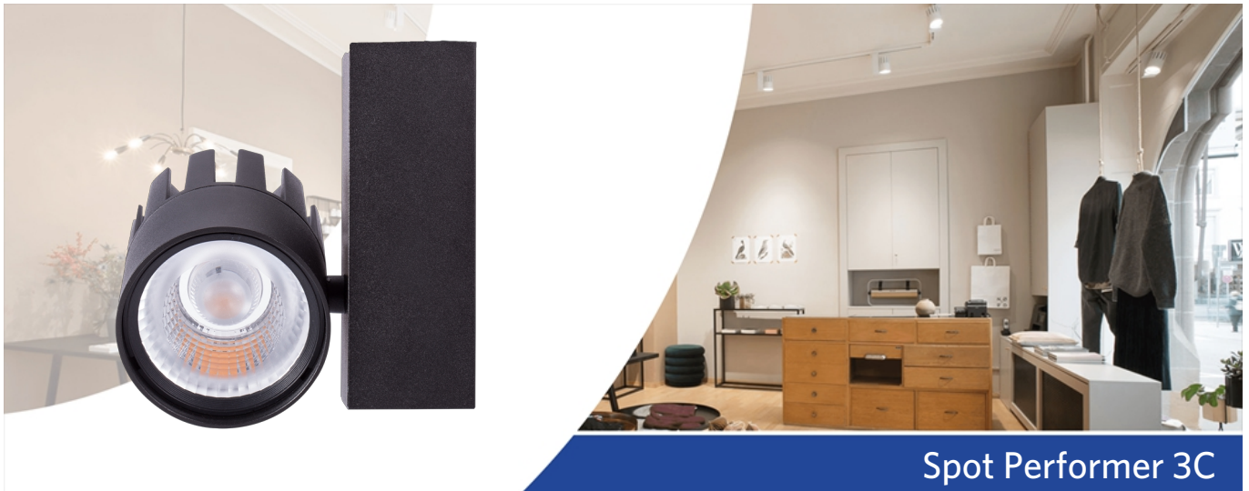
Spot Performer 3C