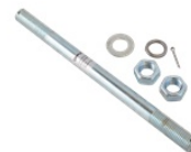
545098003200 LEDHighbay-Pole and Adapter

Highbay Pole and Adapter (545098003200) sind nur mit 80W- und 110W-Versionen kompatibel. Highbay Pole (545098003900) ist nur mit 150W-, 200W- und 220W-Versionen kompatibel.