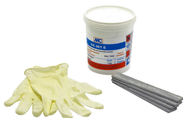
MSET FZRG, Montageset