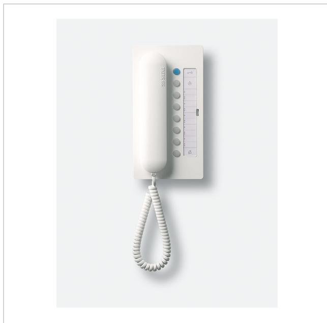
Multi-Telefon HT 840-0 W 200034629-00