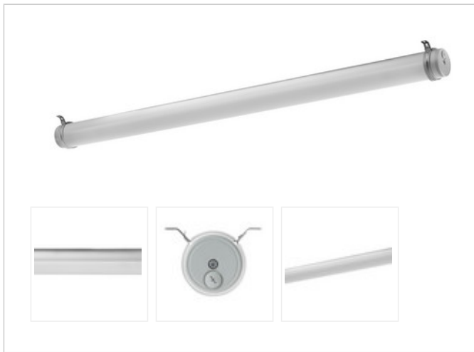
TUBIS N LED