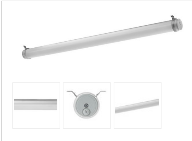
TUBIS N LED