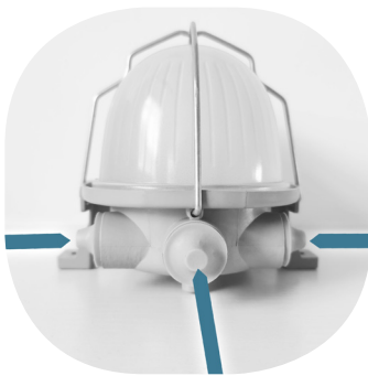
Mit 3 Kabeleinführungen