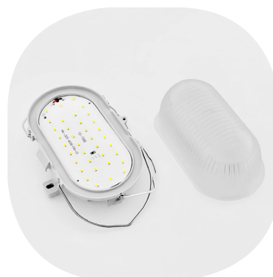
Abdeckung Glas mattiert Schutzkorbbugel umklappbar