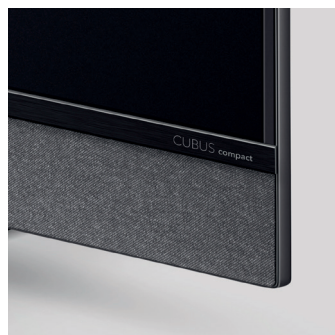
Graphitgraues Akustikvlies mit Zierblende aus gebürstetem Aluminium in Schwarz Brillant und umlaufendem schwarzen Aluminiumrahmen.