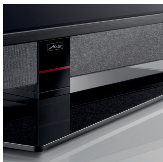
Der formschöne drehbare Glasfuß in Schwarz verleiht ihm stabilen Stand.

Der CUBUS compact verbindet Eleganz und Technik auf kleinstem Raum. Ein wertiger drehbarer Glas-Mittelfuß verleiht dem kompakten Gerät einen soliden Stand. In beiden Größen liefert er brillante Farben und erstklassige Kontraste in Full HD und unterstützt HDR10 sowie HLG für höchste Farbtreue. Auch die übrige Ausstattung sucht in diesem Format ihresgleichen: So sorgt ein einzigartiges Frontlautsprechersystem mit MetzSoundPro-Technologie für satten Klang und klare Sprachverständlichkeit. Über einen Pay-TV-fähigen Triple Twin Tuner, USB-Aufnahme- und Timeshift-Funktionen sowie HbbTV bietet er umfassenden TV-Komfort. Drei HDMI- und zwei USB-Schnittstellen nebst Bluetooth, LAN und WLAN und vielfältige Audioanschlüsse garantieren zusätzliche Flexibilität. Damit ist er perfekt für alle, die einen kompakten Fernseher suchen, ohne auf den Komfort einer Premium-Ausstattung zu verzichten.