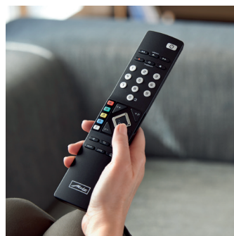
Die übersichtliche Fernbedienung RM18 in Schwarz findet ihr Gegenstück im ebenso aufgeräumten Menü.