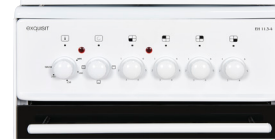
Bedienblende ohne Uhr Übersichtliche Bedienelemente