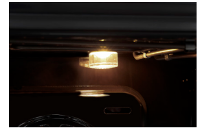
Beleuchtung Helle Beleuchtung des Innenraums