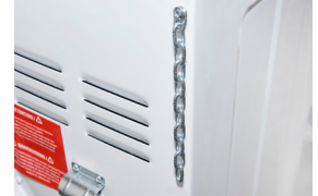
Ketten Ketten für Befestigung an Wand.