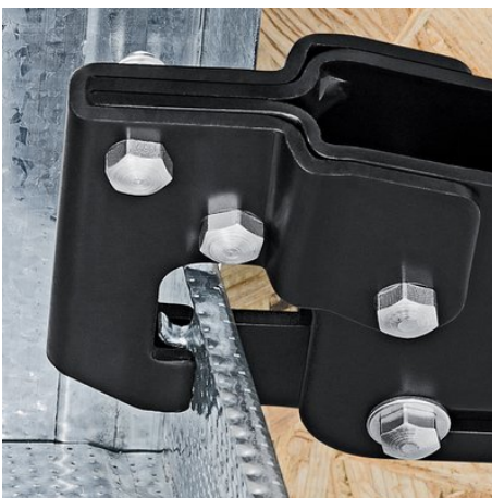
Das Stempelwerkzeug wird durch die Profilbleche gedrückt

Technische Änderungen und Irrtümer vorbehalten