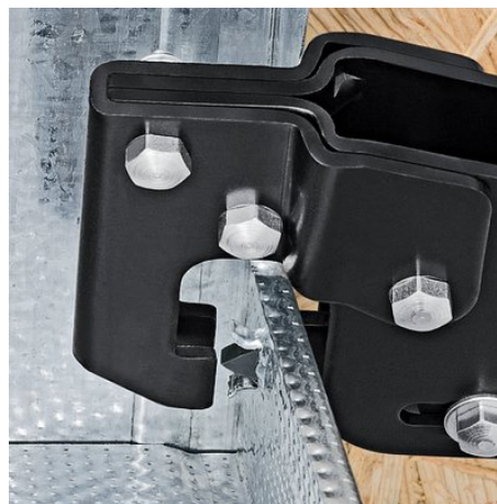
Ansetzen der Zange an zwei zu verbindenden Profilblechen