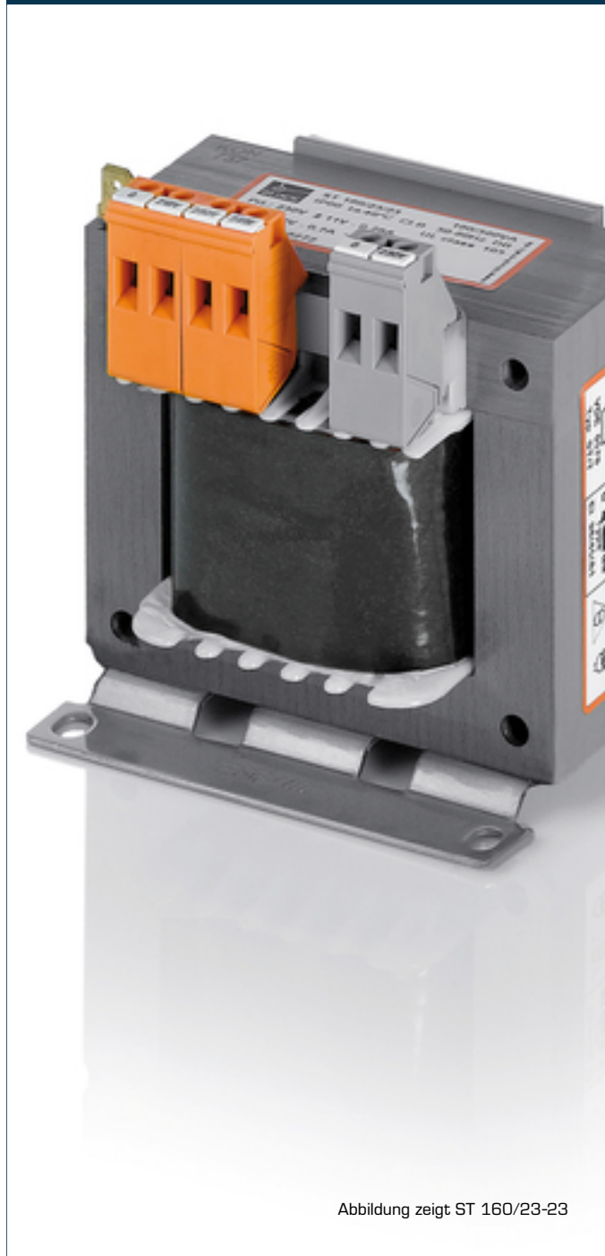
Abbildung zeigt ST 160/23-23