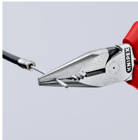
Gefräste Nut im Greifbereich