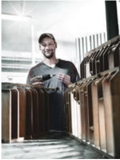
Bits mit reduziertem Schaftdurchmesser