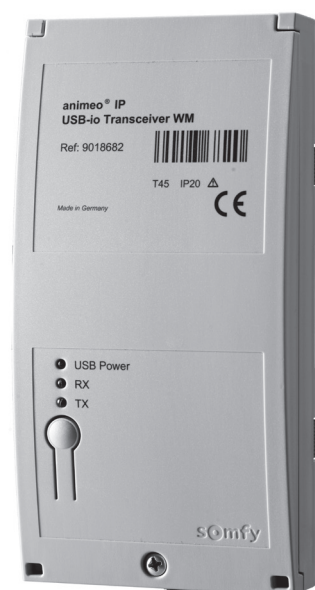
Art. Nr. 9018682