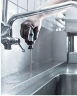
Edelstahl mit Edelstahl verschrauben!