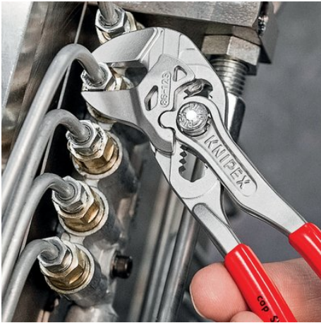
der Mini-Zangenschlüssel für feinmechanische Arbeiten