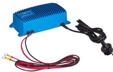
Blue Smart IP67 Ladegerät 12/25