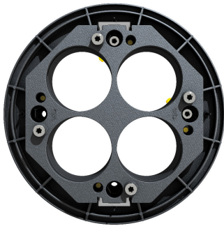
HAW-M ETGAR AD, Mehrfach-Hausausführung ETGAR Außendichtelement