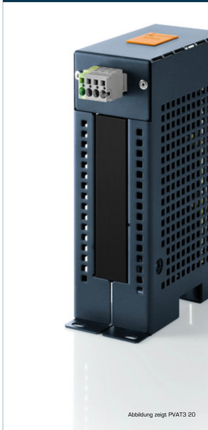
Abbildung zeigt PVAT3 20