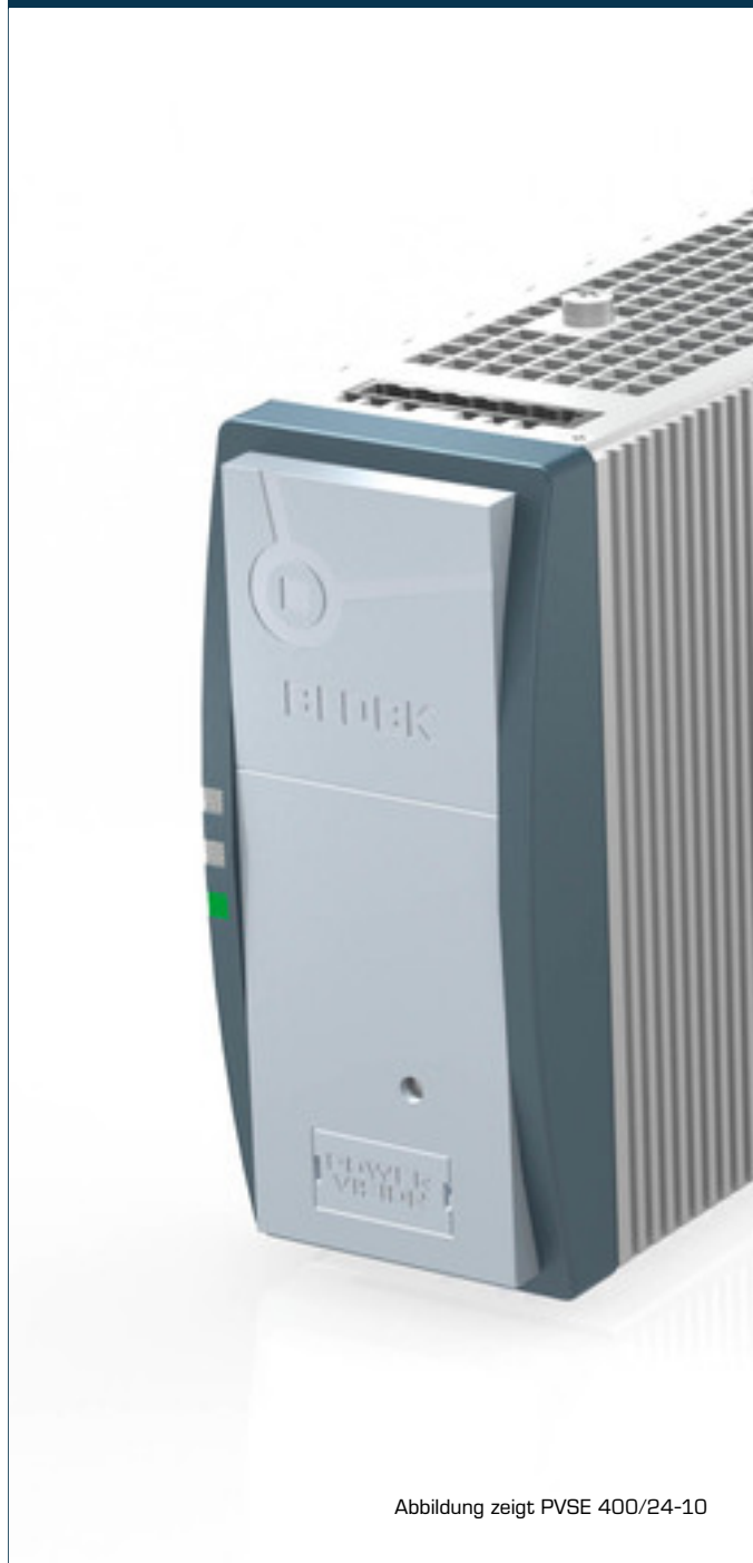
Abbildung zeigt PVSE 400/24-10