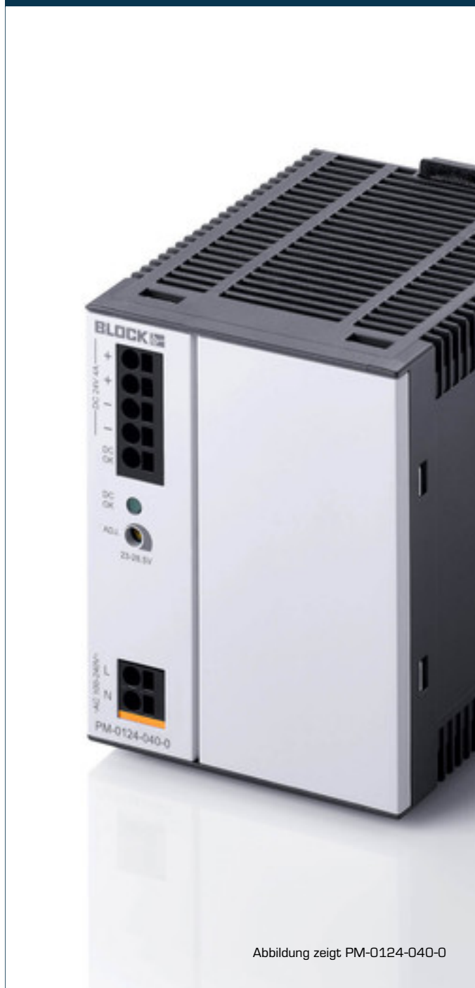
Abbildung zeigt PM-0124-040-0