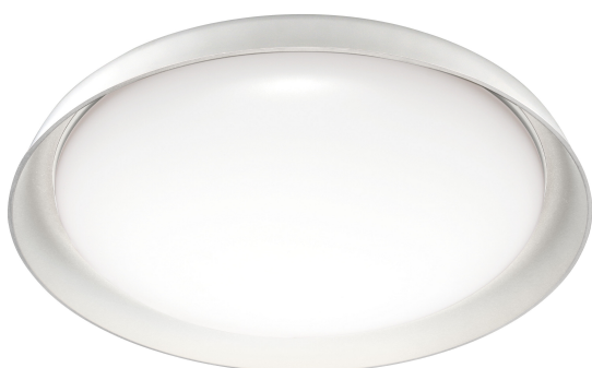
Plate | Dekorative Deckenleuchten mit WiFi-Technologie