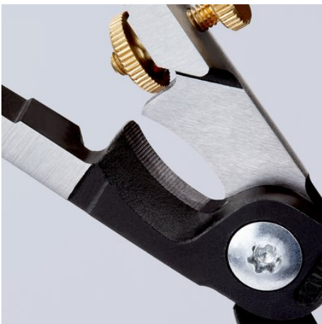
Induktiv gehärtete Präzisionsschneide

Technische Änderungen und Irrtümer vorbehalten