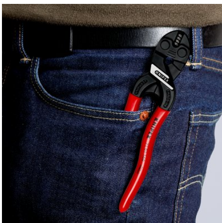
Kompakt, leicht und immer dabei

Technische Änderungen und Irrtümer vorbehalten