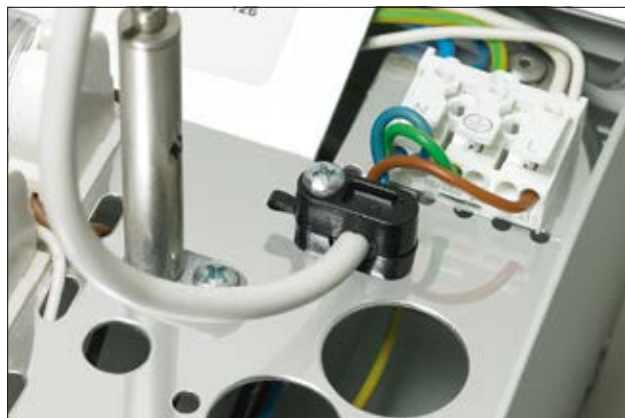
Zugentlastungsschelle Klam-Klip in der Anwendung.