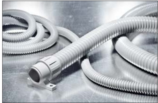
FlexiGuard FG mit Verschraubung FG-UH.