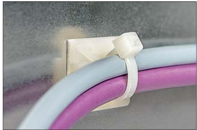
Befestigungssockel der TY-Serie sind als Schraub- oder Klebesockel erhältlich.