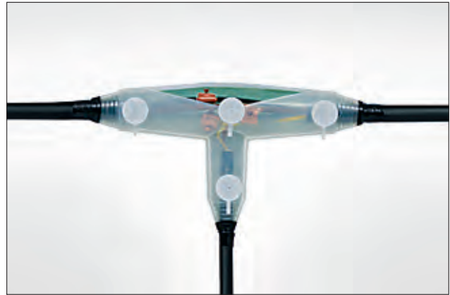
Abzweiggaritur T-Line SF (sicheres Füllen).