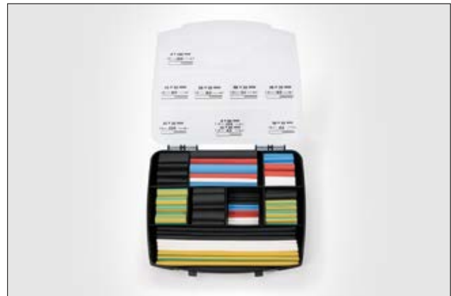
ShrinkKit 321 Universal Basic - Schrumpfschlauch Sortiment mit 177 Abschnitten.