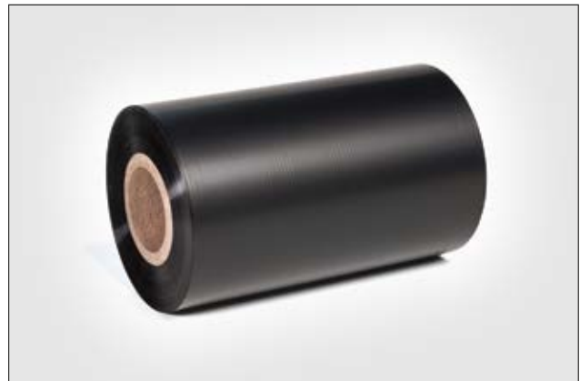
Farbbänder zum Bedrucken von selbstklebenden Etiketten.