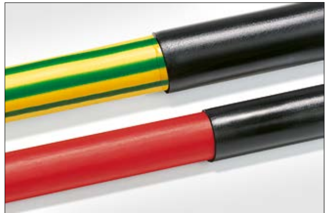
TA32 und TA42 bieten einen guten Schutz gegen Umwelteinflüsse.