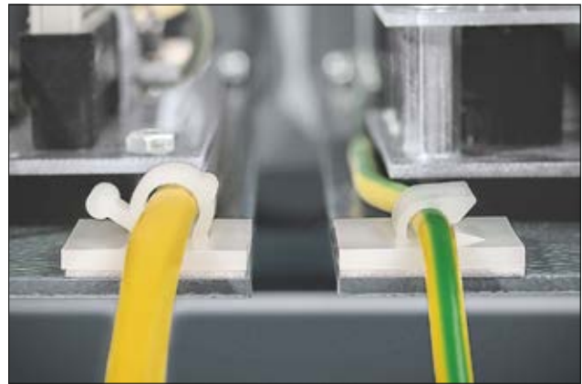
Einteilige, selbstklebende Befestigungssockel RA6 (l) und RB5 (r).